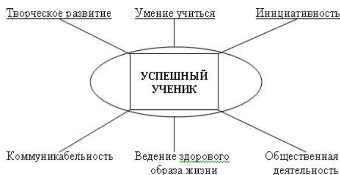
Рис. 1. Критерии успешности ученика.

Что же помогает нам создавать ситуации успеха.